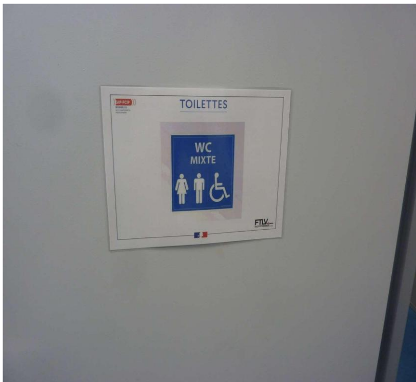
Signalétique toilettes et équipements