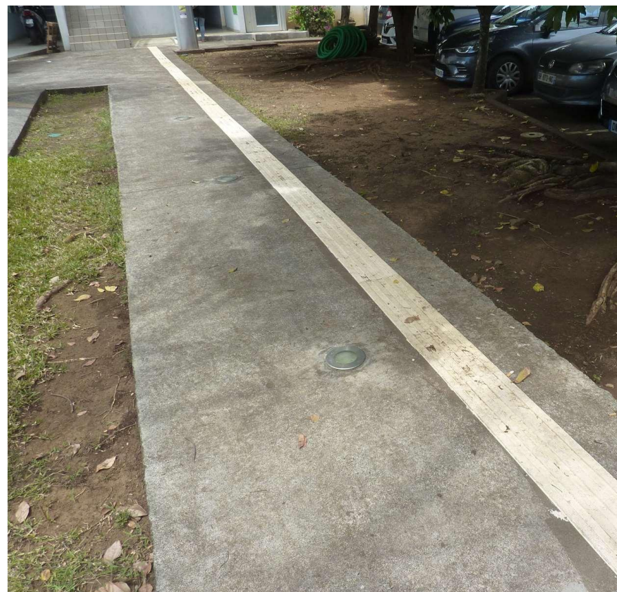
Entrée accès PMR / Bande de guidage au sol podotactile