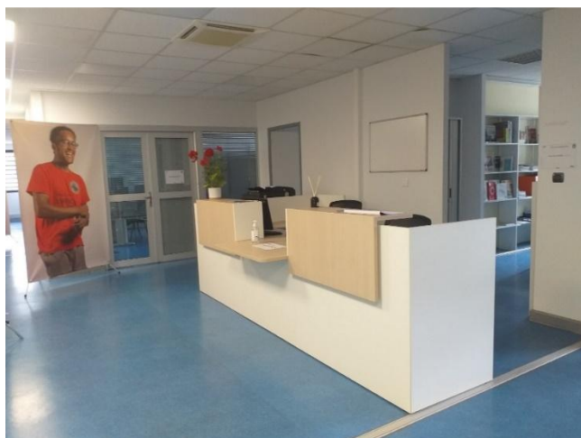
Borne d'accueil et entrée