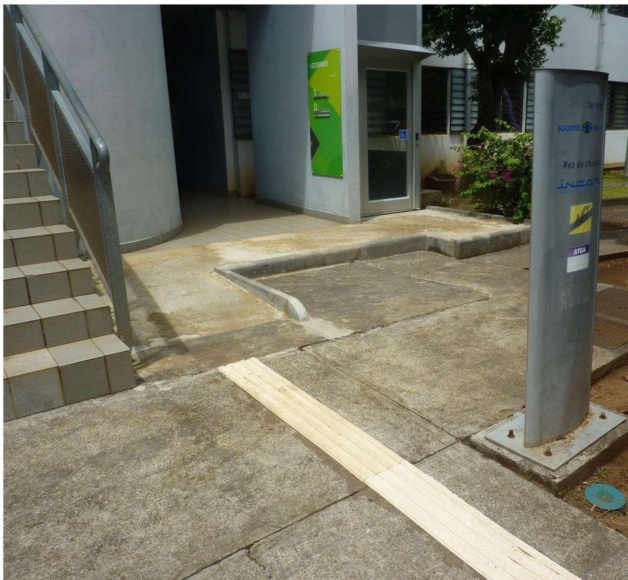
Entrée accès ascenseur